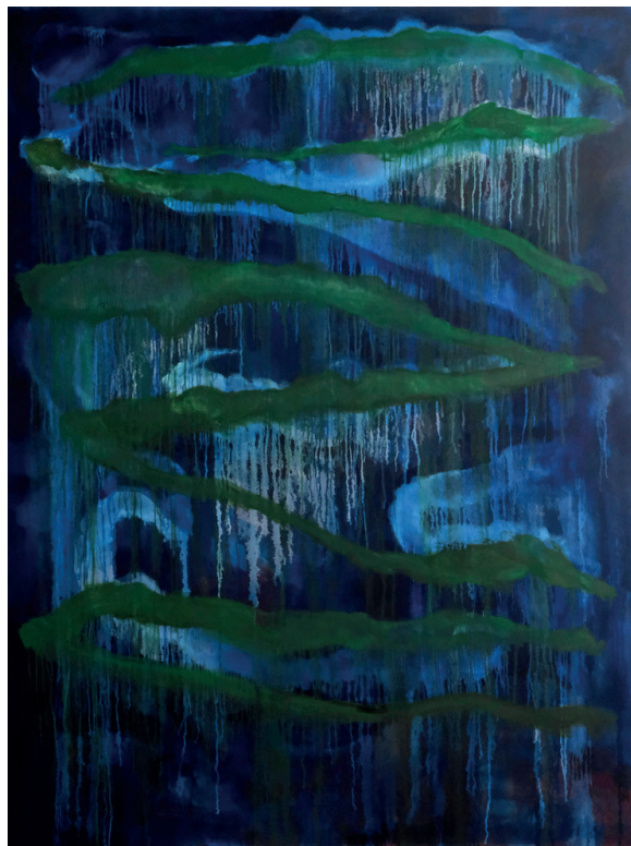
Benoît Blanchard Équinoxe , huile sur toile, 230x165cm, 2024 - Collection privée

« L'île semble telle qu'elle a dû toujours être, depuis l'époque où les dieux venaient s'y promener en sortant de l'onde et où les esprits animaient chaque racine, chaque rocher. Qui sait si la nymphe Calypso n'y a pas un temps résidé en compagnie d'Ulysse ? Si l'on se penche près des racines emmêlées dans la roche, l'île semble nous murmurer toutes sortes de contes de héros, de monstres et de Métamorphoses... ».